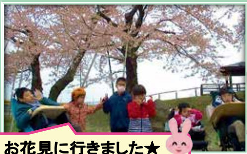
お花見に行きました★