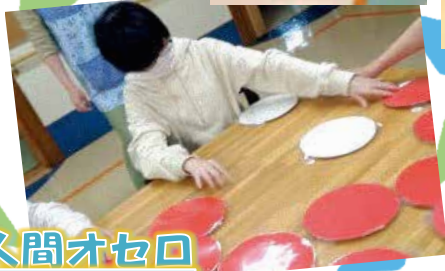
人間オセロ ～テーブルバージョン～