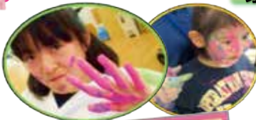
フィンガーペインティング & スライム遊び